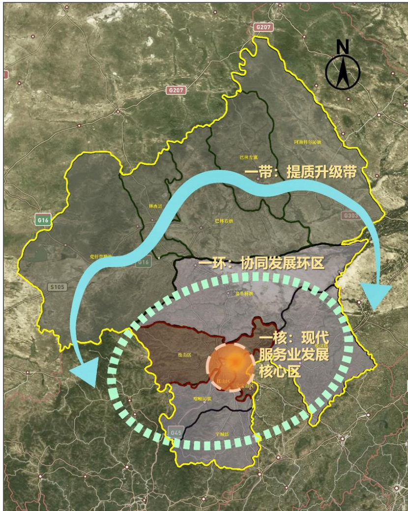
图3 “一核一环一带”345空间布局图

构建以赤峰市中心城区(红山区、松山区、元宝山区3区和喀喇沁旗和美园区)为现代服务业发展核心区,以环中心城区4旗县(喀喇沁旗、宁城县、敖汉旗、翁牛特旗)为协同发展环,以北部5旗县(阿鲁科尔沁旗、巴林左旗、巴林右旗、林西县、克什克腾旗)为提质升级带的“一核一环一带”服务业空间发展格局。